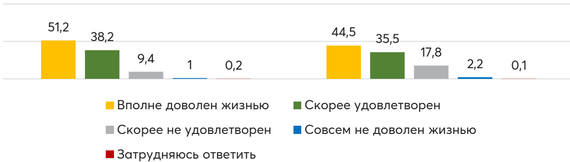
Диаграмма 1. В какой степени Вы лично как гражданин Казахстана, удовлетворены жизнью, которая у вас складывается? % 2021 и 2022 гг

В прошлом году в разрезе районов вполне довольных жизнью и скорее удовлетворенных было больше нежели в 2022 году. Показатели повысились на 8,4% в ответе «скорее не удовлетворен» и на 1,2% «скорее недоволен жизнью».